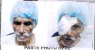
PASTE PHOTO HERE